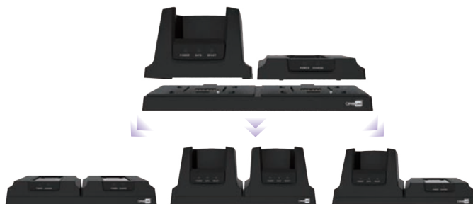
模組化充電傳輸系統

8600系列的彈性設計包括可更換式的按鍵，讓8600系列能輕易的更換為29或39鍵。8600系列也搭配模組化系統，提供多種傳輸座與電池充電器的組合；使用者能輕鬆變更組合方式。這種彈性化設計能減少多餘備貨，降低庫存，同時以更具成本效益的方式提供不同的使用組合。此外，也可讓配件維修與更換程序更為簡單迅速。